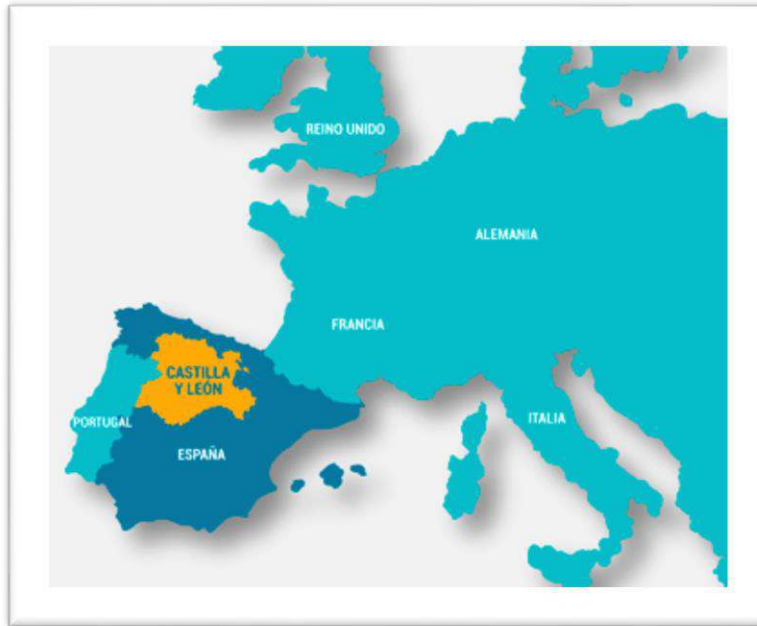
MAPA DE LA COYUNTA URUPEYA ONDE VESE 'L PAÍS LLÏONÉS DESEMEYÁU