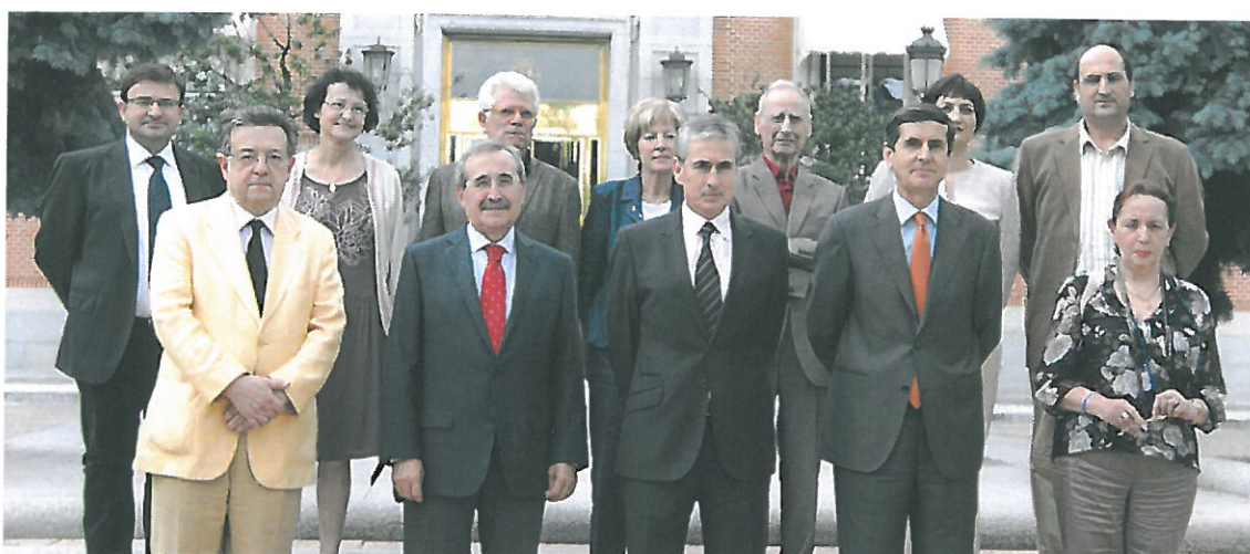
Constitución de la Comisión. Complejo de la Moncloa. Madrid, 30 de mayo de 2011